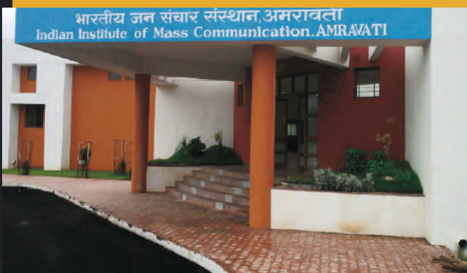
भारतीय जन संचार संस्थान, अमरावती Indian Institute of Mass Communication, AMRAVATI