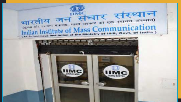
IIMC भारतीय जन संचार संस्थान (सूचना और प्रसारण मंत्रालय, भारत सरकार का एक स्वायत्त संस्थान) Indian Institute of Mass Communication (An Autonomous Institution of the Ministry of I&B, Govt. of India)