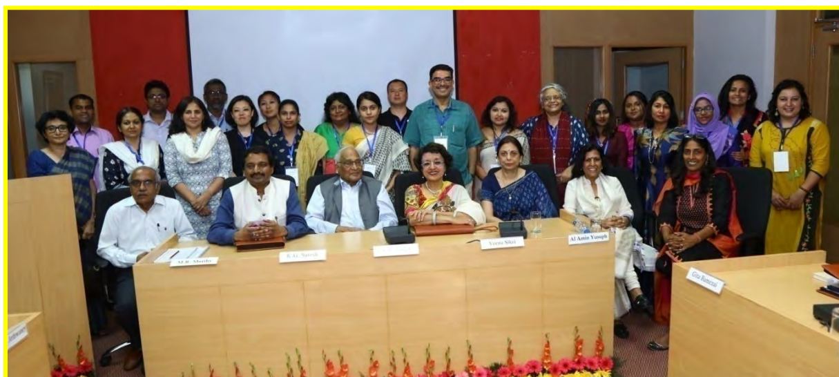
(IIMC-ISID team involved in the UNESCO-SWAN research project on 'Women in Media')

Commemorative Volume On 50 Years Of Communication Research: A Compendium Of 50 Years Of IIMC Research Studies From 1965- 2015 in the digitized form is being prepared as part of Institute's own project