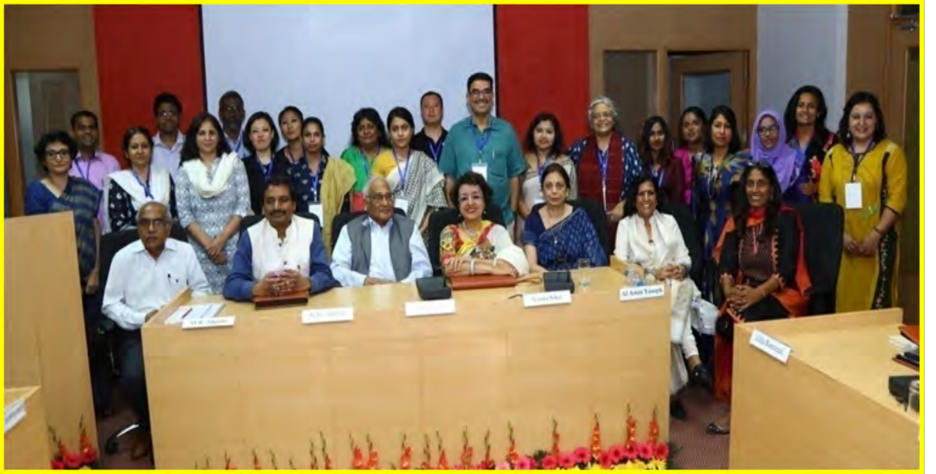
यूनेस्को-स्वान की मीडिया में महिलायें शोध परियोजना में आईआईएमसी-आईएसआईडी टीम

संचार शोध के 50 वर्षों पर स्मारक की मात्रा: 1965- 2015 से आईआईएमसी शोध अध्ययन के 50 वर्षों का एक संग्रह संस्थान के अपने प्रोजेक्ट के हिस्से के रूप में तैयार किया जा रहा है।